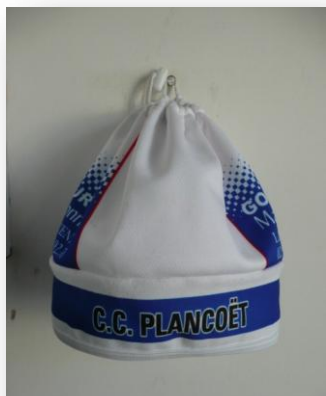
Le bonnet en wind tex et polaire