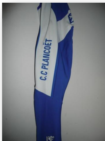
Le cuissard long classique