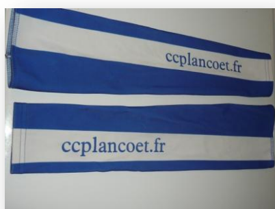
Les manchettes siglées ccplancoet.fr